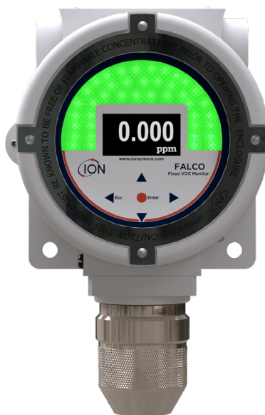
Modelo de 10,6 eV difuso

Registre su producto en línea en el plazo de un mes tras su compra para aumentar su garantía. Visite ION Science.